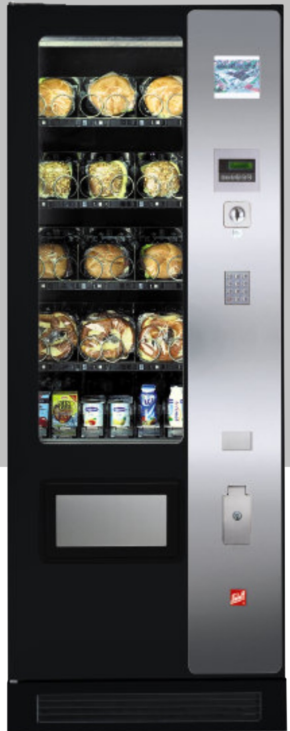
SÜ 1500 LM