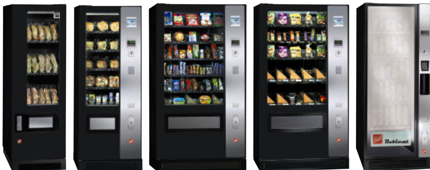
SP 1300 LM

Un groupe froid performant garantit la conservation optimale des produits frais à une température inférieure à +4°C. Le système de ventilation spécial de la version 2T permet une séparation en deux zones de température : une zone inférieure à +4°C sur les 2 ou 3 plateaux inférieurs, et une zone comprise entre +12 et +18°C sur les plateaux supérieurs. En cas de dépassement de la température, la zone des produits frais se déconnecte automatiquement, garantissant ainsi, non seulement, le respect des consignes en vigueur en matière d'hygiène, mais aussi la protection de la santé des clients.